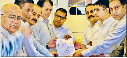
सिरसा। चुनाव लड़ने के इच्छुक नामांकन पत्र भरते हुए।