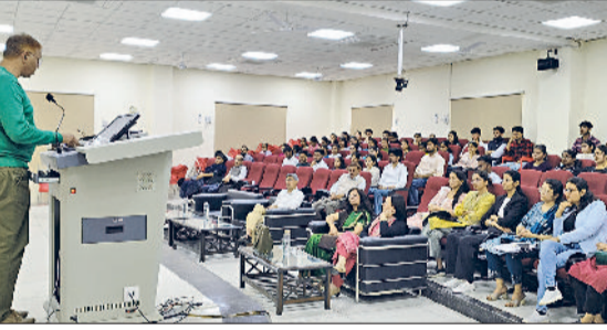
सिरसा। अंतरराष्ट्रीय ई-सेमिनार को संबोधित करते वक्ता।

प्रदेशवासियों को सुख-समृद्धि, शांति और उन्नति की कामना की। इस दौरान उन्होंने 'हारे के सहारे' बाबा श्याम के सुंदर एवं भावपूर्ण भजनों का श्रवण किया। भजनों की मधुर स्वर लहरियों और श्रद्धालुओं की अपार आस्था ने पूरे वातावरण को भक्तिमय बना दिया। फाल्गुन महोत्सव के अवसर पर सतरंगी सजावट, पुष्प वर्षा और भजन संस्था ने कार्यक्रम को और भी दिव्य स्वरूप प्रदान किया।