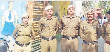
सिरसा। परीक्षा केंद्र के बाहर तैनात पुलिस कर्मचारी।