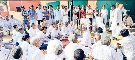
सिरसा। गांव रामपुरा दिल्ली में महापंचायत करते ग्रामीण।