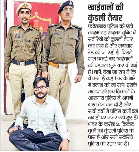
फतेहाबाद। रतिया में क्रिकेट सट्टेबाजी के आरोप में पकड़ा गया युवक।

सट्टेबाजों पर नकेल कसने को लेकर फतेहाबाद पुलिस भी अलर्ट है। सीआईए टोहाना की टीम ने रतिया में एक घर में छापेमारी कर एक युवक को क्रिकेट सट्टेबाजी करते रंगे हाथ काबू किया। पकड़ा गया युवक भारत-जिम्बाब्वे मैच पर सट्टा लगवा रहा था। बता दें कि फतेहाबाद में इस समय 50 से ज्यादा क्रिकेट बुकीज हैं, जिनसे यहां के सैकड़ों युवा करोड़ों रुपये का क्रिकेट सट्टा लगाते हैं। टी-20 वर्ल्ड कप में फतेहाबाद के अनेक युवा बर्बाद हो रहे हैं वहीं कई बुकीज जमकर चांदी कूट रहे हैं। यहां के सैकड़ों परिवार क्रिकेट