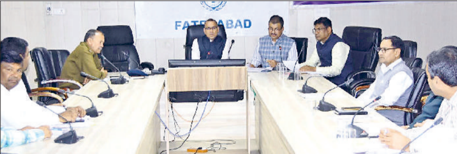
फतेहाबाद। सड़क सुरक्षा समिति की बैठक को संबोधित करते डीसी।